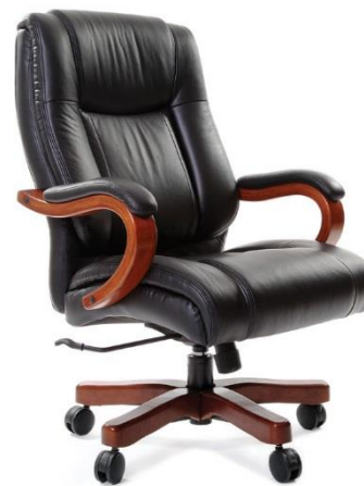
< CHAIRMAN 403 >