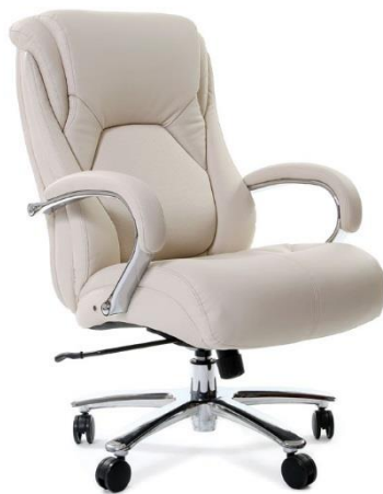
< CHAIRMAN 402 >