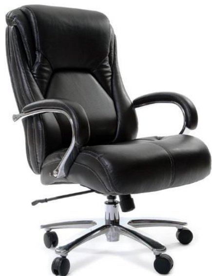
< CHAIRMAN 402 >